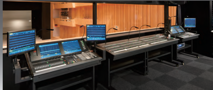
外部カラー液晶ディスプレイ、プリセットコンソールはオプション