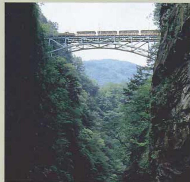
立山連峰と後立山連峰をめぐらうように走る詩情豊かなトロッコ電車。

名古屋営業所 〒460 名古屋市中区栄4-7-10 栄第3ロイヤルビル ☎052(265)1591F0 FAX052(265)1590 広島営業所 〒730 広島市中区大手町3-1-1 コナキティブエムケイビル ☎082(245)8161F0 FAX082(245)1537 福岡営業所 〒812 福岡市博多区博多駅前1-15-20 日本団体生命ビル ☎092(451)3831F0 FAX092(451)3829 金沢工場 〒125 東京都葛飾区金町 2-12-9 ☎03(3607)2166F0 FAX03(3627)2505 川越工場 〒350 埼玉県川越市芳野台 2-8-44 ☎0492(25)7111F0 FAX0492(25)3314