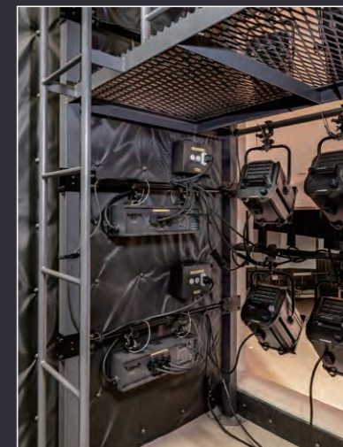
フロントサイドライト