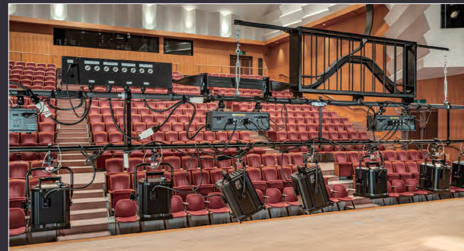
サスペンションライト