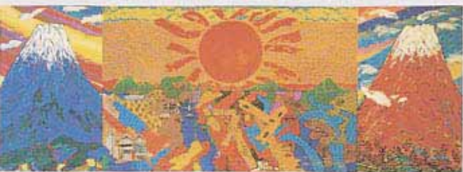
ロビー絵画「旭日・三島讃歌」