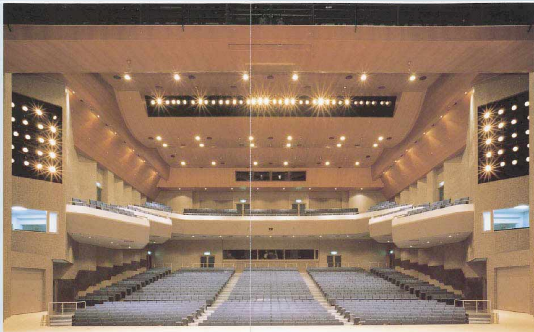
大ホール舞台→客席

メモリーシーン数500シーン, サブページ50ページ, チェイス20パターン×99ステップ (トータル1000ステップ), タイムメモリー0.1~999.9秒 グランドマスターフェーダー.....1本 A-Bクロスフェーダー.....1組 IN-OUTマスターフェーダー.....1本 IN-OUTフェーダー.....1組 タイムエンコーダ.....1本 レベルエンコーダ.....1本 メモリー操作スイッチ.....1式 サブマスターフェーダー.....1本×2 サブフェーダー.....20本×2 プレビュースイッチ.....20ヶ×2 クロススイッチ.....20ヶ×2 段マスターフェーダー.....3本 ページ選択スイッチ.....2式 場面選択スイッチ.....1式 エフェクト操作部.....2式 タッチスイッチ.....1式 P-Fスイッチ.....100ヶ 回路スイッチ.....100ヶ プリセットフェーダー.....100本×3段 フリーフェーダー.....10本 客席自動調光操作スイッチ.....2式 カラーCRT.....1台 3.5インチフロッピーディスク.....2式